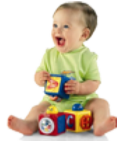
Игрушки для малышей