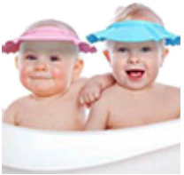
Аксессуары для купания