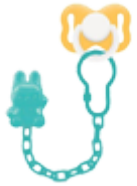
Пустышки и аксессуары