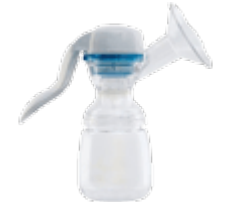
Молокоотсосы и аксессуары