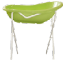
Детские ванночки, горки, сиденья